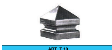
ART. T 19