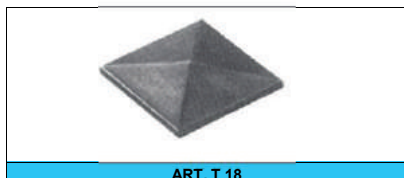
ART. T 18